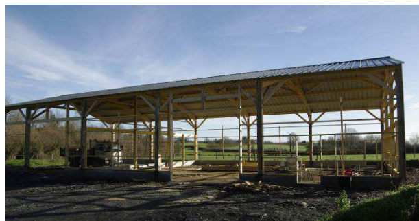
Fabien est en train d'auto-construire un nouveau bâtiment, plus grand et plus fonctionnel pour son activité apicole.

Le projet important est d'améliorer mon outil de travail. Je déplace le siège d'exploitation à un petit kilomètre d'ici. Je suis en train d'auto-construire un nouveau bâtiment, plus grand et plus fonctionnel, qui abritera toutes les activités : la miellerie, le stockage, le local de vente directe. J'ai la chance de me trouver dans un environnement très agréable, avec plusieurs agriculteurs soucieux de l'environnement à proximité.