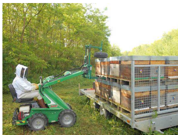
La transhumance : plateau-remorque et élévateur tout-terrain